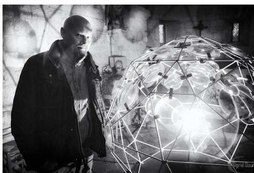
Les plastiqueurs à la création scénographique